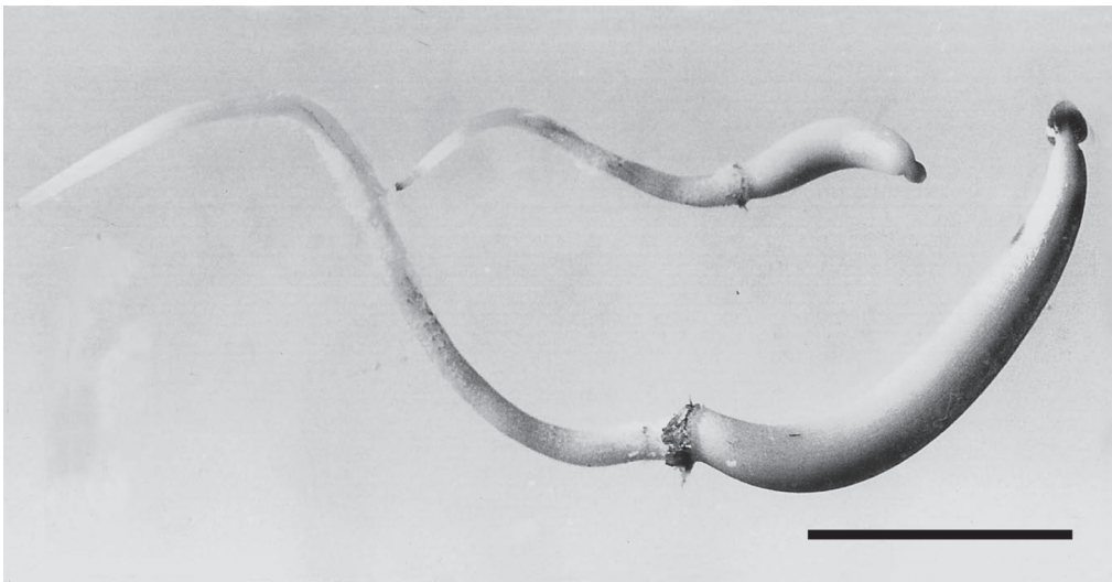
Figura 2. Embriões de tamanhos diferentes originados por poliembrião em Clusia fluminensis Planch. & Triana com 30 dias após a germinação. Barra = 1 cm.

Figure 1a,b. Embryos of different sizes originated from polyembryony in Clusia criuva Cambess. 18 days after germination. Scale bar = 1 cm.