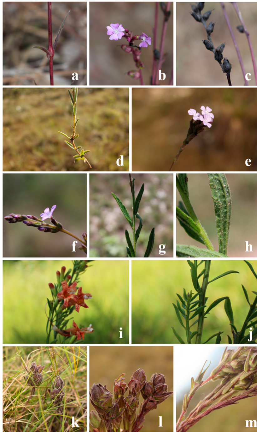
Figura 3. Espécies de Orobanchaceae registradas em campo na Serra de São José e Serra do Lenheiro, Estado de Minas Gerais, Brasil. Buchnera lavandulacea Cham. & Schltldl. a. folhas e galha. b. flores no ápice da espiga. c. frutos. Buchnera rosea Kunth. d. disposição das folhas no ramo. e. flores no ápice da espiga. Buchnera ternifolia Kunth. f. botões florais e detalhes da inflorescência. g. disposição das folhas no ramo. h. indumento da face abaxial da lâmina foliar. Esterhazyia splendida J.C.Mikan. i. flores em evidência. j. disposição das folhas nos ramos. Melasma strictum (Benth.) Hassl. k-l. detalhes dos botões em inflorescências jovens. m. disposição das folhas nos ramos. (fotos: Maria Tereza R. Costa).

Figure 3. Orobanchaceae's species registered in field trips at Serra de São José and Serra do Lenheiro, Minas Gerais State, Brazil. Buchnera lavandulacea Cham. & Schltldl. a. leaves and galls. b. flowers at apex of the spike. c. fruits. Buchnera rosea Kunth. d. leaves distribution on the stem. e. flowers at apex of the spike. Buchnera ternifolia Kunth. f. floral buds and inflorescence details. g. leaves distribution on the stem. h. indumentum of the leaf's abaxial surface. Esterhazyia splendida J.C.Mikan. i. flowers in evidence. j. leaves distribution on the stem. Melasma strictum (Benth.) Hassl. k-l. details of the buds in young inflorescences. m. leaves distribution on the stem. (photos by: Maria Tereza R. Costa).