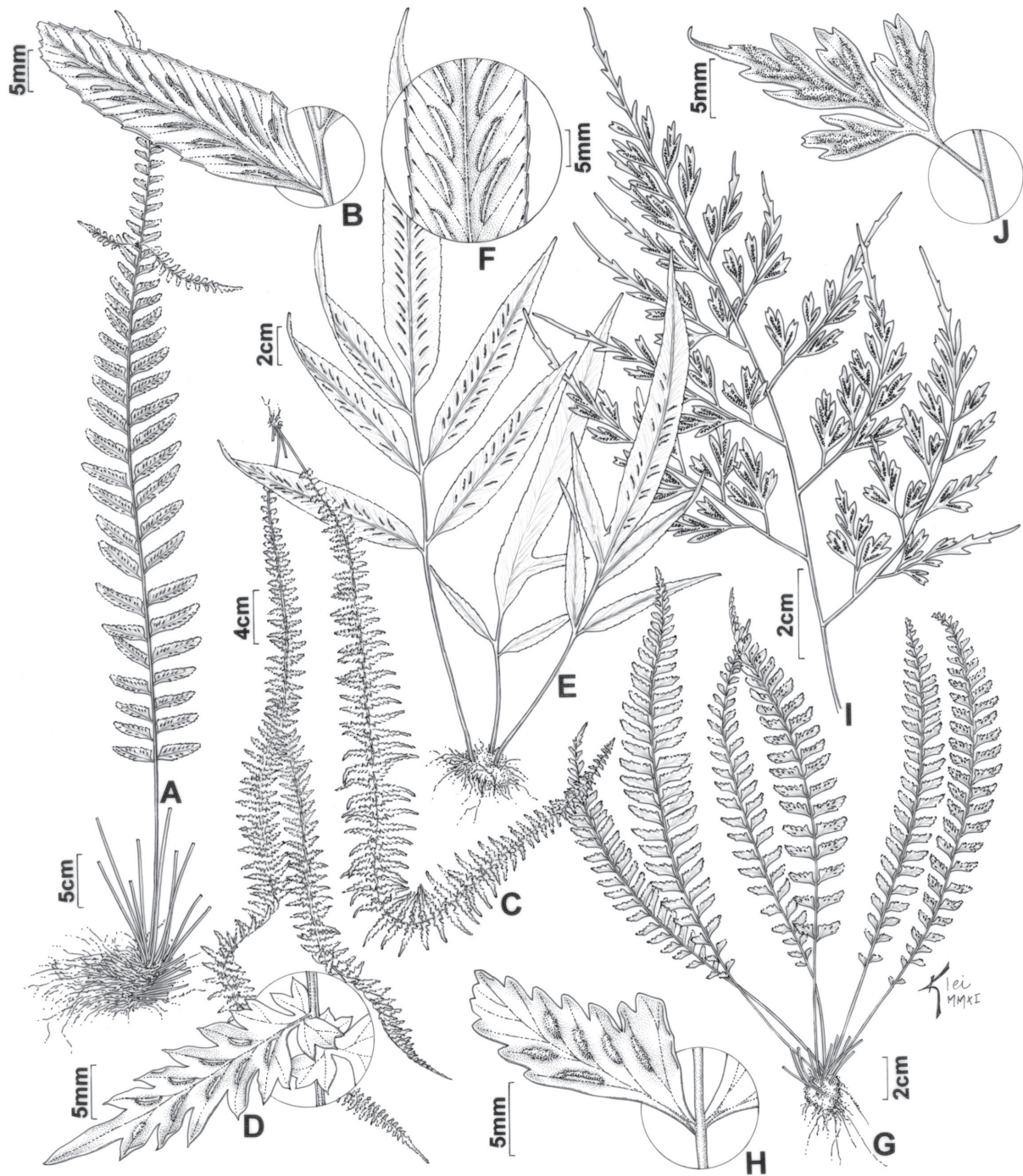
Figura 2. A-B. Asplenium kunzeanum (Handro 272). A. Hábito, mostrando uma fronde com gema prolífera. B. Detalhe de uma pina fértil. C-D. A. mucronatum (Prado 1457). C. Hábito pendente. D. Detalhe do segmento fértil biauriculado, com aurícula bifida acroscopicamente e trifida basicopicamente. E-F. A. oligophyllum (Corrêa 6). E. Hábito. F. Detalhe dos soros. G-H. A. raddianum (Handro 84). G. Hábito. H. Detalhe da pina fértil. I-J. A. scandicinum (Corrêa 131). I. Parte de uma fronde fértil. J. Detalhe do segmento fértil.

Figure 2. A-B. Asplenium kunzeanum (Handro 272). A. Habit showing a frond with proliferous gemma. B. Detail of fertile pinna. C-D. A. mucronatum (Prado 1457). C. Pendent habit. D. Detail of biauriculate fertile segment, with bifid auricle acroscopically and trifid auricle basicopically. E-F. A. oligophyllum (Corrêa 6). E. Habit. F. Detail of the sori. G-H. A. raddianum (Handro 84). G. Habit. H. Detail of fertile pinna. I-J. A. scandicinum (Corrêa 131). I. Part of the fertile frond. J. Detail of fertile segment.