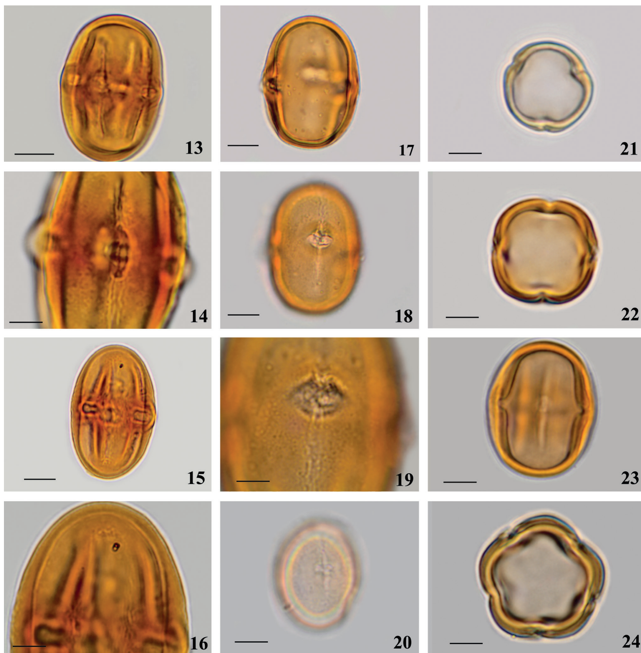
Figuras 13-24. Fotomicrografias dos grãos de pólen de Sapotaceae. 13-14. Micropholis cuneata Pierre ex Glaziou. 13. Vista equatorial, contorno. 14. Vista equatorial, detalhe dos cólporos e ornamentação. 15-16. Pouteria bullata Baehni. 15. Vista equatorial de grão de pólen 4-colporado. 16. Corte óptico. 17-19. Pouteria laurifolia (Gomes) Radlk. 17. Vista equatorial, corte óptico. 18. Vista equatorial evidenciando o cólporo. 19. Detalhe do cólporo e da ornamentação. 20-21. Pouteria reticulata (Engl.) Eyma. 20. Vista equatorial evidenciando o cólporo e a ornamentação. 21. Vista polar, contorno. 22-24. Pradosia lactescens (Vell.) Radlk. 22. Vista polar de grão de pólen 4-colporado. 23. Vista equatorial mostrando o cólporo. 24. Vista polar de grão de pólen 5-colporado. Figuras 13, 15, 17, 18, escala = 10 \mu m. Demais figuras, escala = 5 \mu m.

Figures 13-24. Photomicrographs of pollen grains of Sapotaceae. 13-14. Micropholis cuneata Pierre ex Glaziou. 13. Equatorial view, contour. 14. Equatorial view showing the colpi and ornamentation. 15-16. Pouteria bullata Baehni. 15. Equatorial view of 4-colporate pollen grain. 16. Optical section. 17-19. Pouteria laurifolia (Gomes) Radlk. 17. Equatorial view, optical section. 18. Equatorial view showing the colporus. 19. Detail of the colporus and ornamentation. 20-21. Pouteria reticulata (Engl.) Eyma. 20. Equatorial view, showing the colporus and ornamentation. 21. Polar view, contour. 22-24. Pradosia lactescens (Vell.) Radlk. 22. Polar view of 4-colporate pollen grain. 23. Equatorial view, showing the colporus. 24. Polar view of 5-colporate pollen grain. Figures 13, 15, 17, 18, scale = 10 \mu m. The Other figures, scale = 5 \mu m.