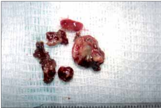
Figura 1. Peça cirúrgica pós sinusotomia maxilar.