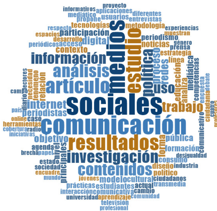
Figura 2. Nube de palabras de frecuencias resúmenes en español

A continuación, se analizan los contenidos de los 127 resúmenes que se encuentran en español, que se observan en la Figura 2: