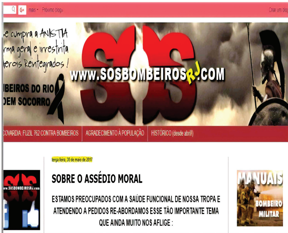
Figura 1. Matéria sobre assédio moral.

As supostas práticas de assédio moral no CBMERJ também aparecem em outros contextos dos blogs , ou seja, não é uma exclusividade dos profissionais do APH, ao ponto de uma matéria de 2015 sobre o assunto ter sido republicada em maio de 2017 (figura 1).