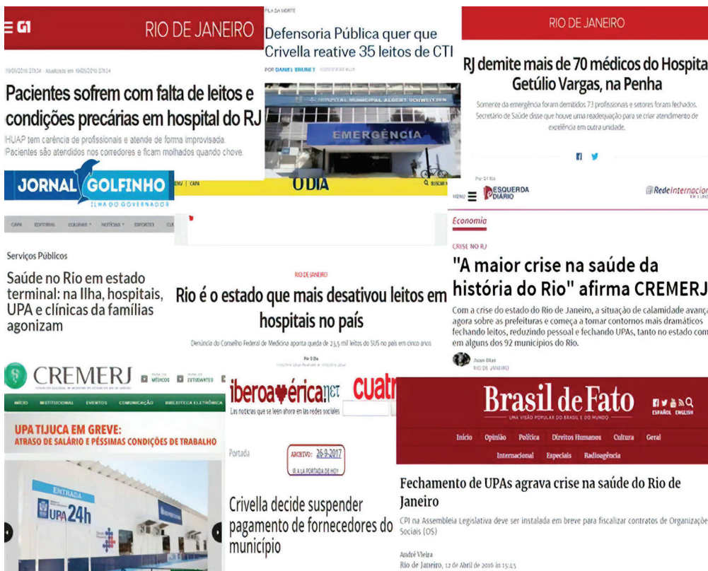
Figura 3. Sucateamento da rede de atenção à saúde no Rio de Janeiro.