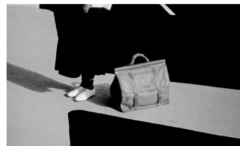
STEVE HIET, fotografia.

Nesta modalidade, os processos de trabalho são cada vez mais ordenados por uma redução dos núcleos de competência às capacidades de produção de modos bem estruturados de atos de saúde, enquanto procedimentos, que não deixam mais nítido quem comanda quem: se o trabalhador ao seu saber, ou se o saber pontual ao trabalhador. A redução e endurecimento das caixas de ferramentas tecnológicas, para a garantia de procedimentos focais cada vez mais restritos e válidos em si mesmos, tornam-se um martírio e ao mesmo tempo um êxito do exercício do trabalho médico. Esta modelagem hegemoniza-se de tal modo, como conformação do trabalho em saúde em geral nas nossas sociedades, que se faz presente no conjunto dos processos produtivos do setor. Inclusive no campo das ações de saúde pública. A dimensão centrada no profissional praticamente elimina, ou reduz ao máximo, a dimensão cuidadora como componente da ação competente do profissional médico.