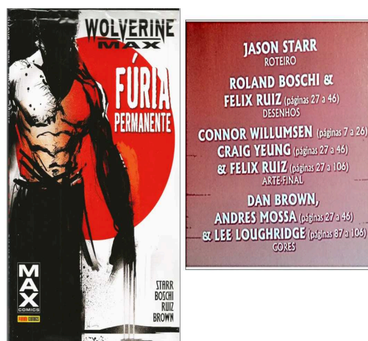
Figura 2: Créditos de Wolverine Max.

Vemos que não há critério regular para os créditos atribuídos nas capas de quadrinhos (que pode ser muito mais uma questão jurídica do que de valoração autoral), mas em geral, o crédito maior é dado para o roteirista e o desenhista. E os critérios para atribuição autoral (aqueles que buscam estabelecer a identidade concomitante de uma Obra e seu Autor) são igualmente nebulosos, fazendo parecer que essa convenção é fruto da mais proeminente subjetividade de um público.