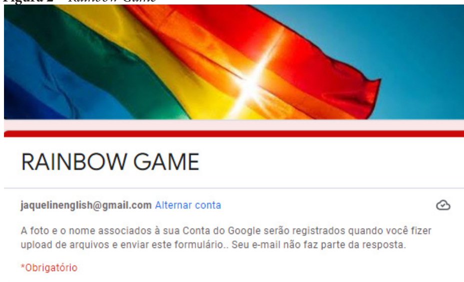
Figura 2 – Rainbow Game