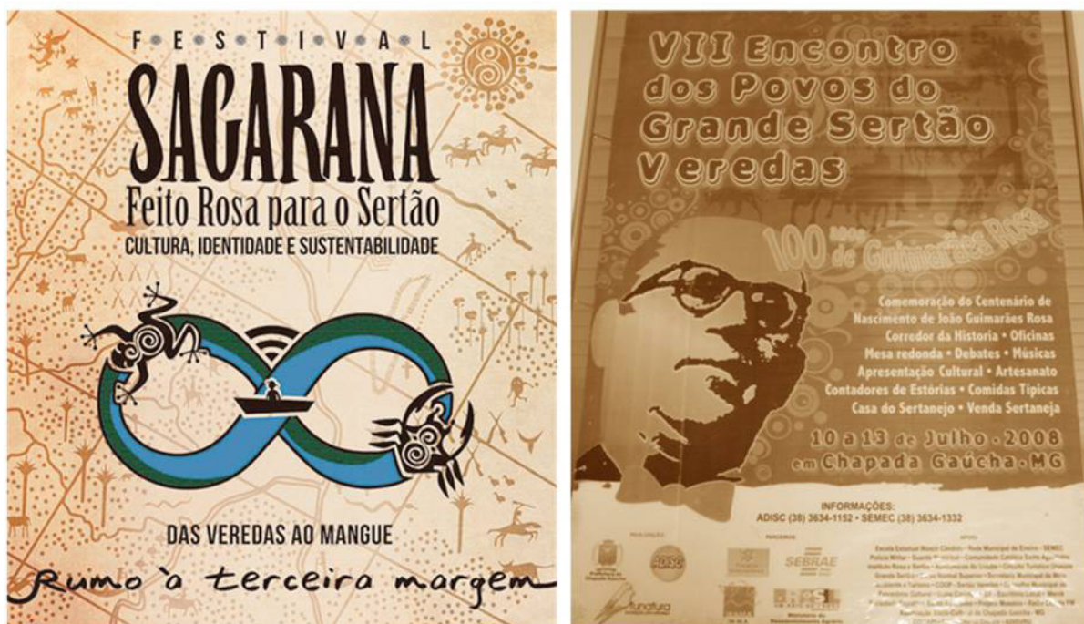
Figura 2 – Folhetos de divulgação do VI Festival Sagarana (2013) e do VII Encontro dos Povos do Grande Sertão Veredas (2008).

justamente, a ideia de reflexão dessa abrangência, do desconhecido e do incerto. Coincide aqui que tanto o Festival como o Encontro são eventos eminentemente políticos em que são realizadas discussões diversas, incluindo as políticas públicas em curso, culturais, ambientais, territoriais, entre outras. A partir disso e em adição, opera-se um tipo particular de turismo, o turismo político, engajado, que pode ser contraposto ao “turismo convencional regional”, de grande relevância, mas que, por sua vez, acessa intensamente elementos artístico-culturais massificados.