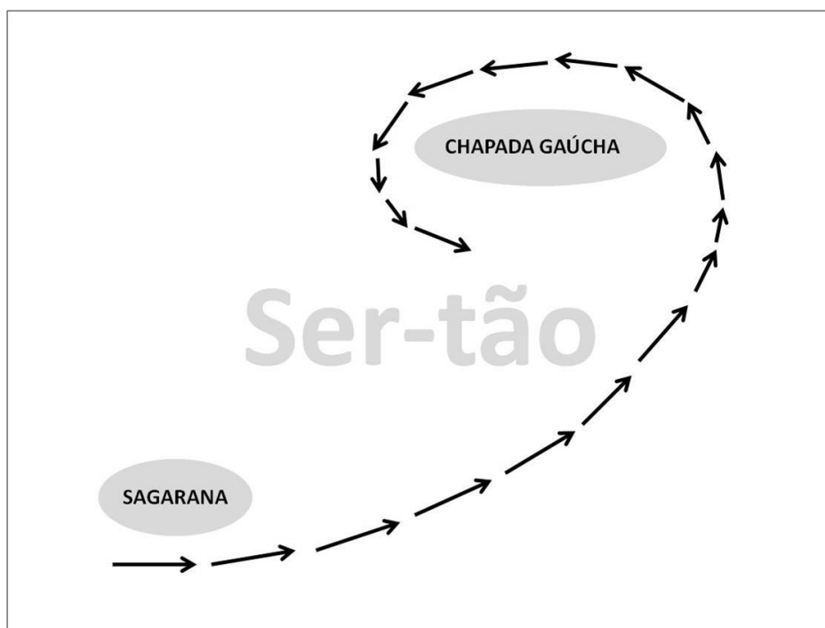
Figura 3 – Caminho do Sertão como representação de “ser-tão”.