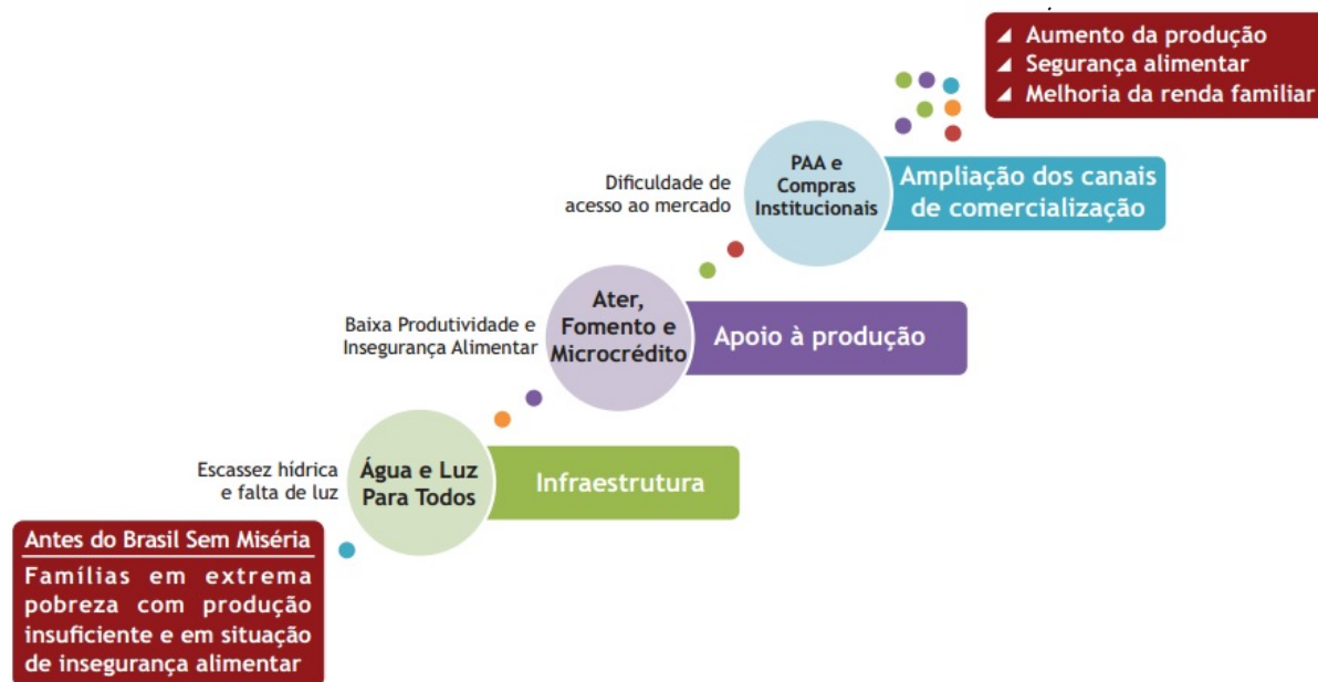
Figura 3 – Rota da inclusão produtiva rural no PBSM