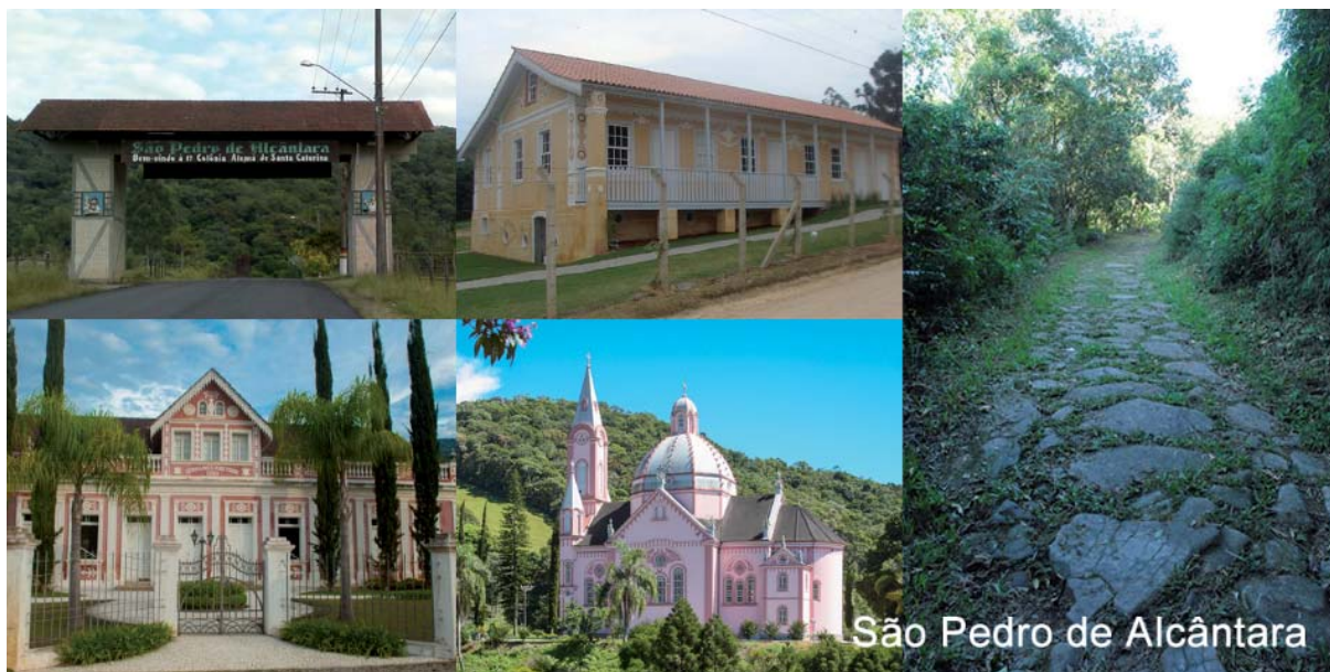
Figura 4 - Atrativos turísticos do município de São Pedro de Alcântara: Portal Turístico, Casa Cultural São Pedro, Caminho do Salto, Vila Kretzer e Igreja Matriz

histórico cultural, em nível estadual, pelo Decreto n. 5.979/2002 (FUNDAÇÃO CATARINENSE DE CULTURA, 2002). Outro exemplo é um antigo armazém, também tombado pela municipalidade, pela Lei Ordinária n. 011/1999 (SÃO PEDRO DE ALCÂNTARA, 1999) e que atualmente abriga um museu histórico regional, a Casa Cultural São Pedro.