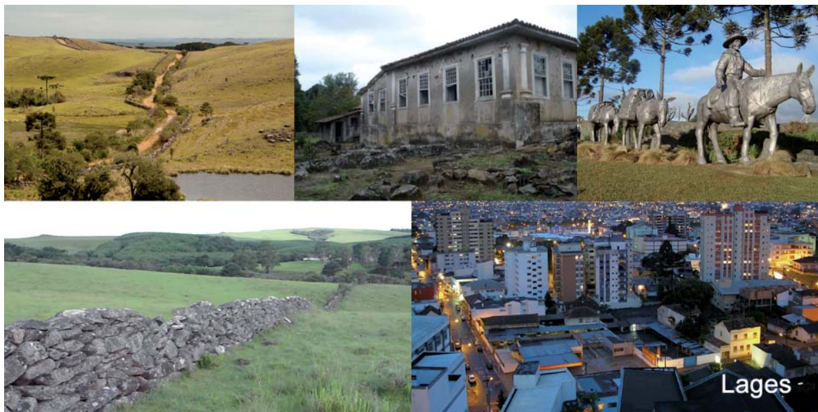
Figura 8 - Atrativos turísticos do município de Lages: Coxilha Rica, Fazenda Cajuru. Monumento os Tropeiros, Taipa de Pedra e vista da cidade.

O Turismo Rural, além do comprometimento com as atividades agropecuárias, caracteriza-se pela valorização do patrimônio cultural e natural como elementos da oferta turística no meio rural. Assim, os empreendedores, na definição de seus produtos de Turismo Rural, devem contemplar com a maior autenticidade possível os fatores culturais, por meio do resgate das manifestações e práticas regionais (como o folclore, os trabalhos manuais, os “causos”, a gastronomia), e primar pela conservação do ambiente natural. (BRASIL, 2006, p. 19, grifos do autor).