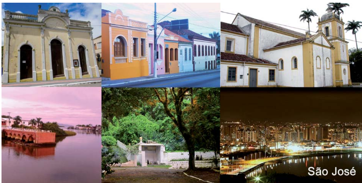
Figura 3- Atrativos turísticos do município de São José: Theatro Adolfo Mello, Centro Histórico, Igreja Matriz, Píer do Rio Maruim, Beco da Carioca e vista noturna da cidade

Outra edificação histórica que se destaca no município de São José é a Ponte do Rio Maruim, construída em 1857, como parte do projeto para uma segunda rota para o Caminho das Tropas. Denominado de “estrada nova”, esse caminho promoveu um desvio do trajeto inicialmente traçado, o que acabou isolando a Colônia de São Pedro de Alcântara e de Angelina, desagradando os moradores daquela região. Em 1995, a ponte foi destruída por enchente, restando apenas parte de sua cabeceira – atual Píer do Rio Maruim, tombado pelo Decreto n. 18.703/2005 (SÃO JOSÉ, 2005b) como patrimônio histórico e cultural de São José.