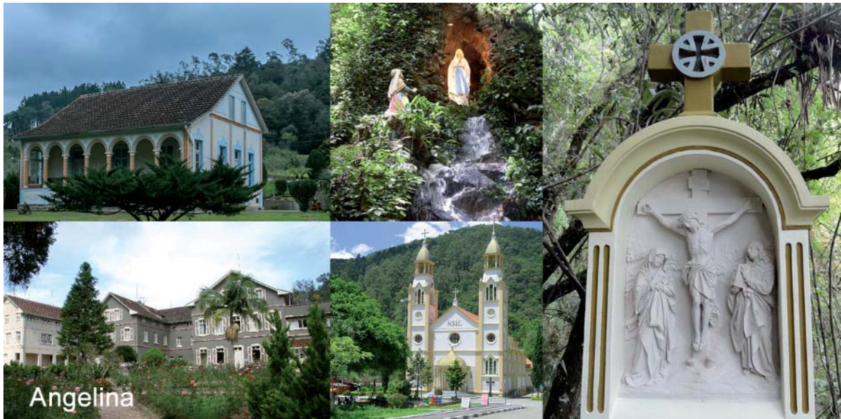
Figura 5 - Atrativos turísticos do município de Angelina: Museu da Congregação das Irmãs Franciscanas, Gruta Nossa Senhora de Lourdes, Via Sacra (XII Estação: Jesus morre na cruz), Convento Irmãs Franciscanas e Igreja Matriz