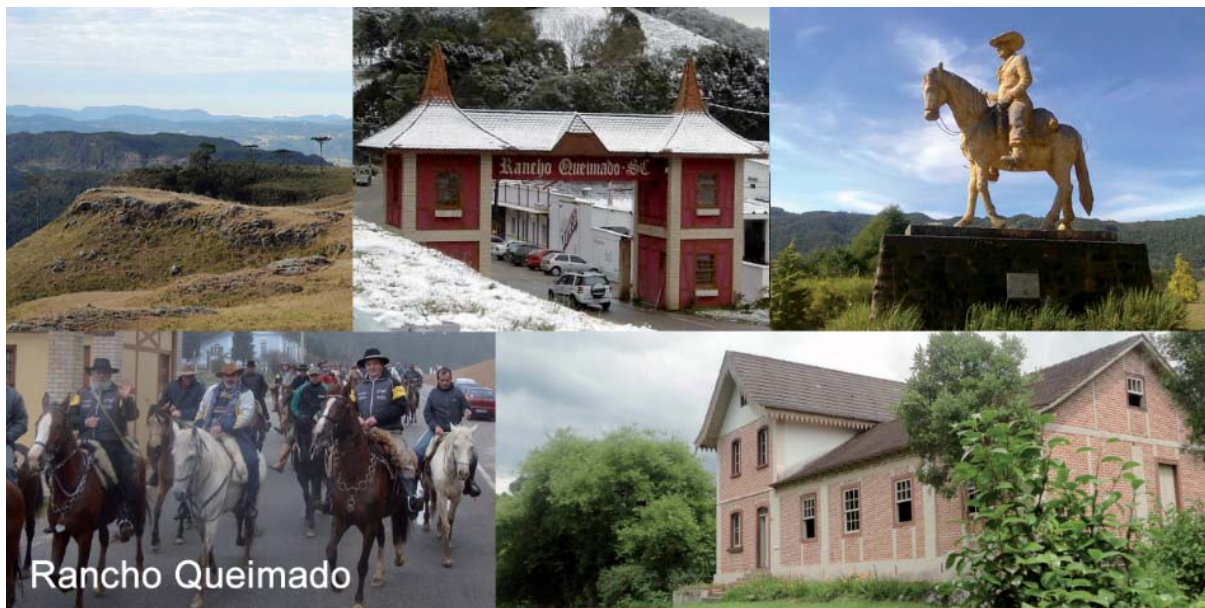
Figura 6 - Atrativos turísticos do município de Rancho Queimado: Mirante da Boa Vista (1.200m), Portal Turístico, Monumento ao Tropeiro, Tropeada (Festa do Tropeiro) e Museu Casa de Campo Governador Hercílio Luz