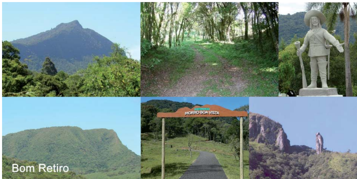
Figura 7 - Atrativos turísticos do município de Bom Retiro: Morro da Boa Vista (1.827m), Calçada, Monumento Antônio Marques Arzão, Morro do Trobudo (1.306m), Portal de acesso ao Morro da Boa Vista e Costão do Frade