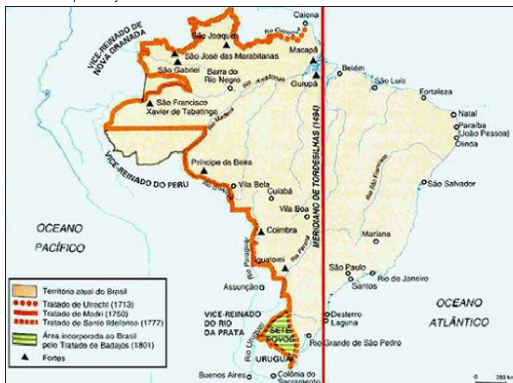
Figura 2 – Marcado de Tratados Tratado de Madrid, Tratados de Utrech, Santo Idelfonso y Badajós en territorio fronterizo brasileño