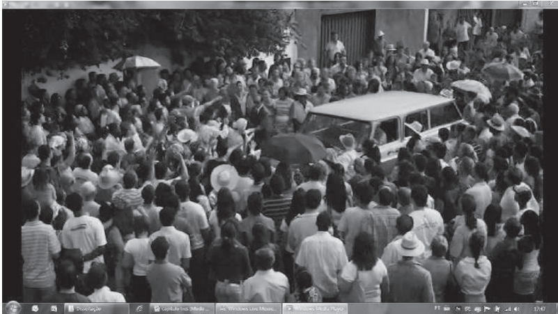
Figura 10 – Chico é tietado por uma multidão

Chico Xavier chega a Belo Horizonte e há uma multidão na rua esperando por ele. As pessoas acenam, aproximam-se do carro onde ele está. Querem tocá-lo, beijá-lo, em um movimento de adoração a um ídolo. Ele desce do carro e acena para o povo, pega na mão de algumas pessoas e entra, em meio à multidão, no Centro Espírita.