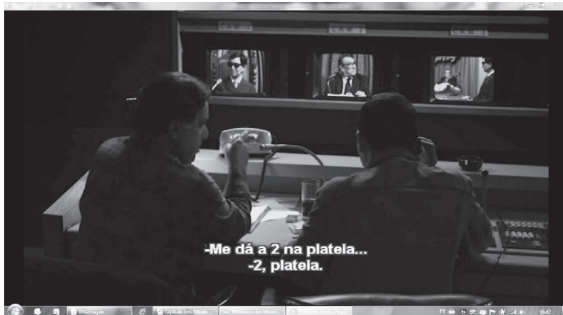
Figura 4 – Orlando pede para filmar a plateia

com imagens de Chico Xavier e dos entrevistadores. A aprovação da plateia é mais uma estratégia de conquista de audiência, objetivando mostrar o médium como uma personalidade, uma celebridade que possui muitos fãs.