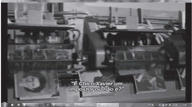
Figura 9 2 – Revista com a reportagem sobre Chico Xavier

obter a resposta que há tanto tempo espera. É Chico Xavier um impostor ou não é? E dirá: dei 1500 por esta revista e não consegui desvendar o mistério? Sim, o mistério continuará por muito tempo. Ou, talvez, para sempre.