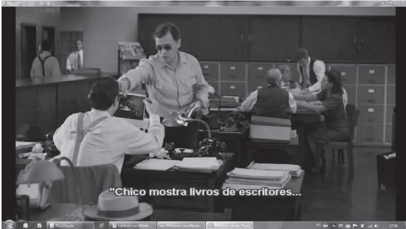
Figura 8 – Jornalistas festejam reportagem sobre Chico

HD: — Chico mostra livro dos escritores que depois coincidentemente psicografou. (...) Parece ser um homem que possui uma vida de sacrifício como a dos santos. Entretanto, sua vaidade nas fotos é evidente. E mais importante: nossa entrevista foi fruto de uma farsa. Isso mesmo. Uma farsa. Como Chico Xavier também pode ser.