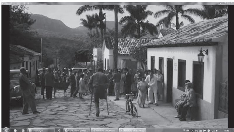
Figura 6 – Muitas pessoas esperam por Chico