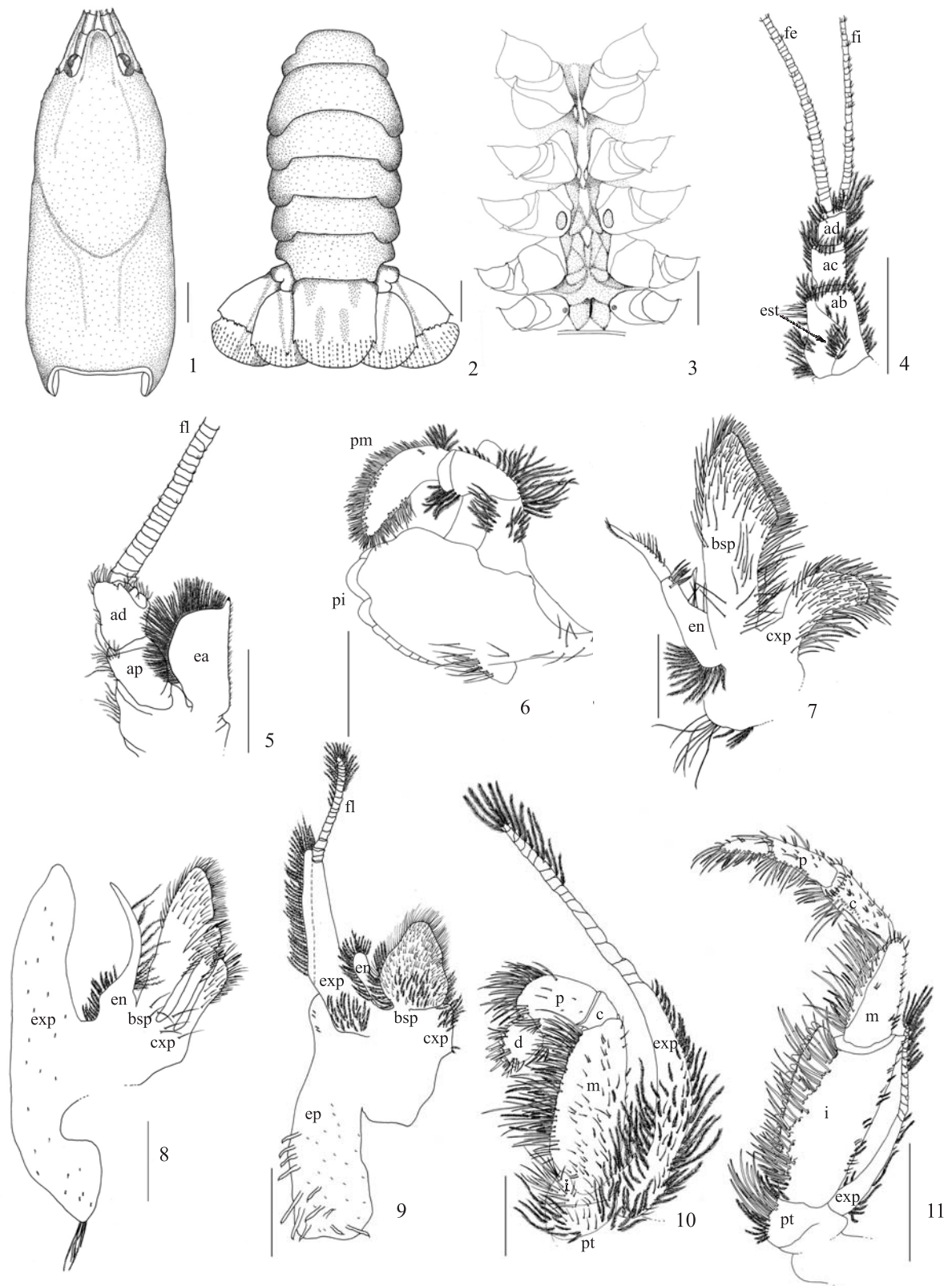
Figs. 1-11. Parastacus brasiliensis (von Martens, 1869): 1, cefalotórax, dorsal; 2, abdômen, dorsal; 3, região torácica, ventral; 4, primeira antena, dorsal; 5, segunda antena, dorsal; 6, mandíbula, aboral; 7, primeira maxila; 8, segunda maxila; 9, primeiro maxilípodo; 10, segundo maxilípodo; 11, terceiro maxilípodo. (ab, artículo basal; ac, artículo central; ad, artículo distal; ap, artículo proximal; bsp, basipodito; c, carpodito; exp, coxopodito; d, dactilopodito; ea, escama antenal; en, endopodito; ep, epipodito; est, estatocisto; exp, exopodito; fe, flagelo externo; fi, flagelo interno; fl, flagelo; i, isquiopodito; m, meropodito; p, propodito; pi, processo incisor; pm, processo molar; pt, protopodito). Escalas, Figs. 1-5, 8, 9, 11:5mm; Fig. 6:3mm; Figs. 7, 10:2,5mm.