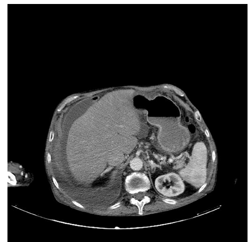
Figura 1. Coleção abdominal encapsulada, sugestiva de abscesso, no fígado.

O cateter de DP foi removido imediatamente, mas o paciente evoluiu com hipotensão (pressão arterial média <70 mmHg), alteração do estado mental e disfunção hepática (bilirrubina total: 14,8 mg/dL; albumina: 1,7 g/dL, e plaquetas 110,000/ \mu L) o que totaliza um score de Avaliação Sequencial de Falência de Órgãos de 10. Dadas as múltiplas comorbidades e a dependência quotidiana anterior à hospitalização, o paciente não preenchia os critérios para os cuidados intensivos. Foi realizada uma tomografia computadorizada (TC) no 8º dia, que revelou uma coleção abdominal encapsulada, sugestiva de um abscesso (Figura 1), desde o lobo direito do fígado até a região supravesical. Considerando o alto risco de sangramento (Razão Normalizada Internacional de 1,9), o paciente foi rejeitado para drenagem percutânea e também para cirurgia em razão de sua insuficiência cardíaca grave. Acabou por falecer 10 dias depois, sob medidas paliativas.