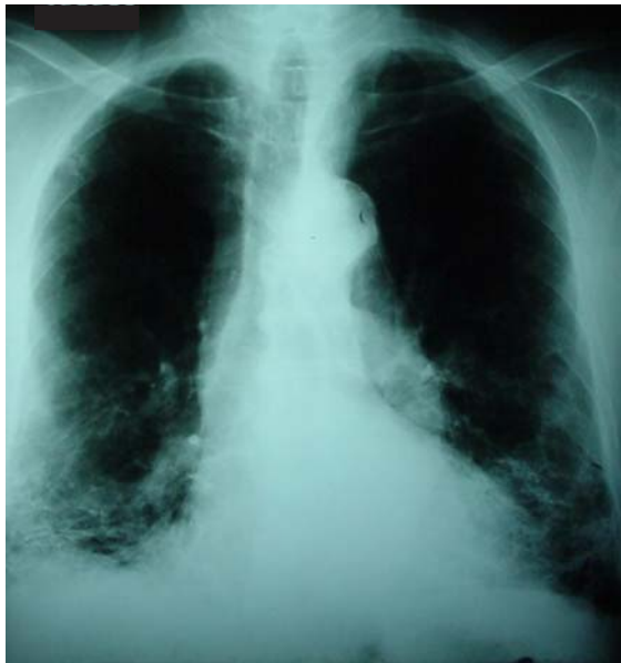
Figura 1 - Radiografia de tórax com infiltrado intersticial retrátil em bases pulmonares e aumento difuso da transparência pulmonar em campos médios e superiores. Aumento da área cardíaca e aorta ectasiada e ateromatosa

apresentava-se dispnéico (frequência respiratória de 30 incursões por minuto), taquicárdico (frequência cardíaca de 120 batimentos por minuto), com estertores em velcro em bases, bulhas hipofônicas e edema +/4+ em membros inferiores. A radiografia torácica (Figura 1) apresentou infiltrado intersticial retrátil em bases pulmonares, retificação de cúpulas frênicas com contornos mal-definidos, aumento difuso de transparência pulmonar em campos médios e superiores, imagem cardíaca aumentada, e aorta ectasiada e ateromatosa. A tomografia computadorizada de alta resolução do tórax (Figura 2) mostrou infiltrado intersticial reticular retrátil em lobos inferiores, com espessamento de septos interlobares associado a componente cálcico evidente à esquerda, enfisema centrolobular em lobos superiores, espessamento pleural esquerdo, aorta ectasiada e ateromatosa, e área cardíaca normal. A espirometria revelou distúrbio ventilatório misto. Os exames laboratoriais apresentaram os seguintes resultados: leucograma - 13.000 8/67/0/0/16/9; creatinina - 1,83 mg/dl; cálcio: 8,8 mg/dl; fósforo: 4,2 mg/dl. A gasometria arterial em ar ambiente mostrou: pH: 7,4; pressão parcial de oxigênio no sangue arterial: 78 mmHg; bicarbonato: 27,1 mmHg; pressão parcial de gás carbônico no sangue arterial: