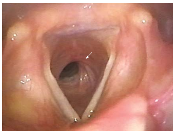
Figura 3 – Broncoscopia: estenose laringo-traqueal.

de crescimento para fibroblastos, o que explicaria também a sua incidência quase absoluta nas mulheres. (10) Um estudo cita inclusive a possibilidade de em alguns casos o paciente ter sido intubado ocasionalmente e por pouco tempo, sem que este fato possa ocasionar a estenose pós-intubação, como no nosso segundo caso, em que a paciente foi intubada por poucas horas, 24 anos antes do aparecimento do quadro da EIT. (8)