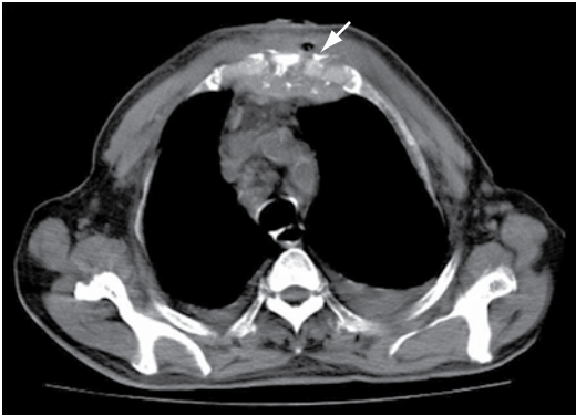
Figura 3 - TC de tórax em corte axial, mostrando lesão osteolítica esternal sem invasão mediastinal (seta branca) e derrame pleural bilateral.

1-3% dos casos de TB, e o acometimento de esterno corresponde a menos de 1%. (4,5) A TB esternal ocorre predominantemente em adultos jovens do sexo masculino moradores de regiões endêmicas com ou sem fatores predisponentes. (2) A forma de contaminação pode ocorrer a partir de linfonodos locais infectados, por contiguidade com o parênquima pulmonar ou por reativação de um foco quiescente. (6)