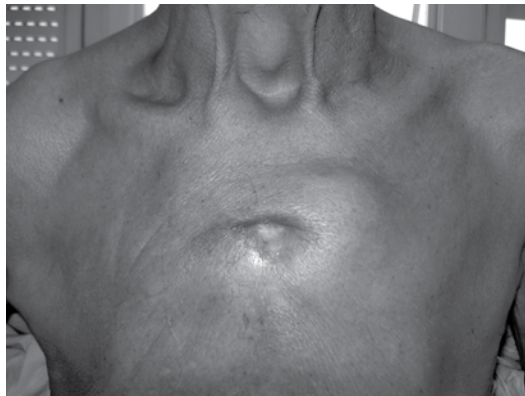
Figura 1 - Lesão na região esternal com fistula drenando material purulento.

confirmando o diagnóstico de osteomielite esternal tuberculosa.