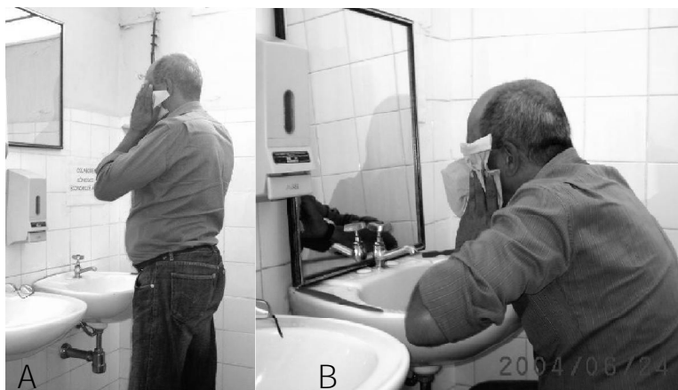
Figura 1 - A) Paciente realizando as atividades de higiene pessoal sem a utilização das técnicas de conservação de energia; B) Paciente realizando as atividades de higiene pessoal utilizando as técnicas de conservação de energia

Outras soluções podem ser encontradas para