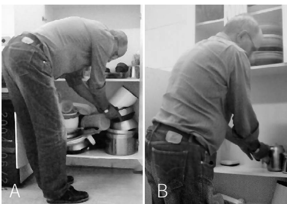
Figura 4 - A) Paciente realizando a atividade de guardar utensílios em prateleiras baixas sem a utilização das técnicas de conservação de energia; B) Paciente realizando a atividade de guardar utensílios em prateleiras baixas utilizando as técnicas de conservação de energia