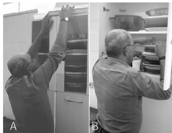
Figura 3 - A) Paciente realizando a atividade de guardar utensílios em prateleiras altas sem a utilização das técnicas de conservação de energia; B) Paciente realizando a atividade de guardar utensílios em prateleiras altas utilizando as técnicas de conservação de energia