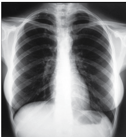
Figura 2 - Radiografia no oitavo dia de pós-operatório, demonstrando ausência de derrame pleural, clips metálicos e a ausência da primeira costela direita.

Durante a liberação da inserção clavicular do músculo esternocleidomastoideo foi observado um extravasamento de conteúdo linfático, atribuído à ruptura de um vaso linfático transitando posteriormente. Apesar da exploração minuciosa, não foi possível a visualização do vaso linfático roto, sendo realizada sutura em bloco dos tecidos fasciais sob o músculo esternocleidomastoideo com polipropileno 5.0, local onde se originava o acúmulo de linfa, seguida de ressecção da primeira costela e da costela