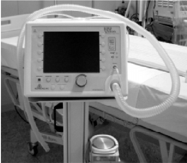
Figura 4 - Equipamento utilizado para ventilação não invasiva – BIPAP vision