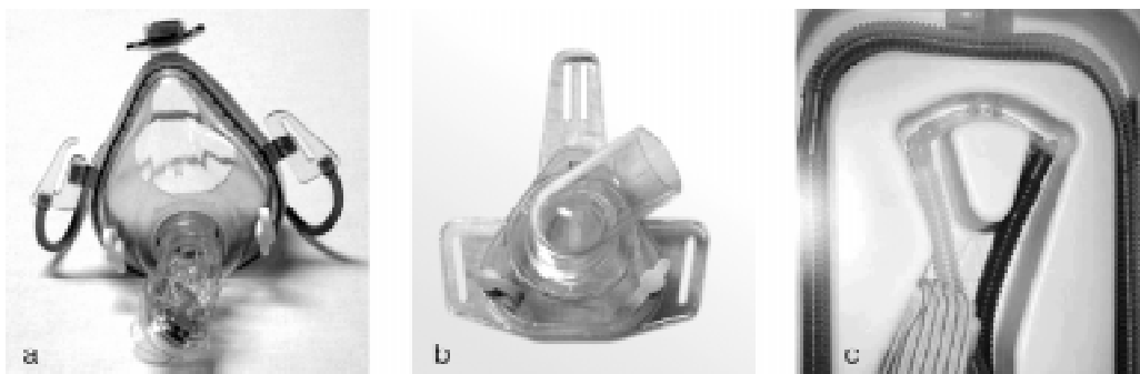
Figura 3 - Tipos de máscaras: a) máscara orofacial, b) máscara nasal, c) duplo tubo nasal

É uma forma de ofertar oxigênio com um pouco de pressão, em geral com uma pressão média de via aérea (MAP) em torno de 5 cmH 2 O. Melhora a ventilação em áreas colapsadas, muito usada na forma de CPAP nasal em neonatologia e CPAP sob máscara em pacientes com edema pulmonar cardiogênico e em fisioterapia respiratória.