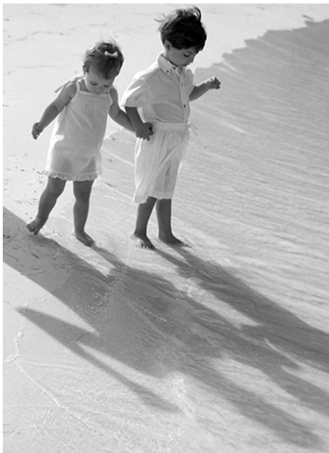
Figura 2 - "Regra da sombra": bom horário de exposição a ambiente aberto, observado pela boa sombra das crianças em relação à sua altura.

As principais organizações de saúde visual nos EUA recomendam que os óculos de sol absorvam entre 97 e 100% do espectro completo da UVR (ou seja, até 400 nm) 14 . Recomenda-se que as pessoas utilizem óculos de sol quan-