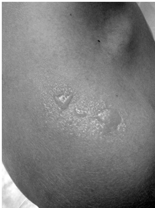
Figura 1 - Queimadura solar com formação de bolhas em criança: exemplo de susceptibilidade ao câncer cutâneo nos anos vindouros

índice de UVR. Devemos conscientizar as pessoas de que o uso do fotoprotetor, por si só, não garante a proteção necessária em termos de prevenção contra o câncer cutâneo.