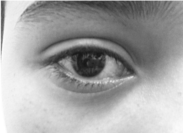
Figura 1 - Conjuntivite e edema palpebral em paciente com síndrome periódica associada ao receptor de TNF (TRAPS)

do, com aparência serpigínea ou reticulada 47 . Manifestações oculares são frequentes (49% dos casos), podendo haver conjuntivite e uveíte, com dor e vermelhidão e/ou edema periorbitário 6,47 . A Figura 1 mostra paciente portador de TRAPS apresentando conjuntivite e edema palpebral.