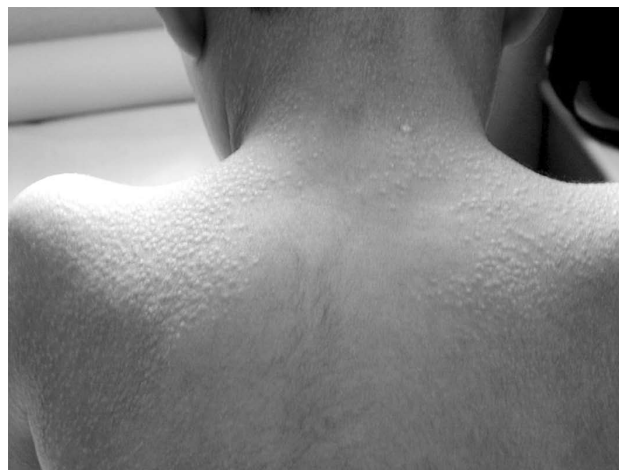
Figura 3 - Exantema ictiosiforme em paciente com sarcoidose de início precoce

AGP é uma doença caracterizada pela inflamação granulomatosa crônica de olhos, articulações e pele, que se inicia geralmente antes dos 4 anos de idade 118 . Artrite é observada em 100% dos pacientes, sendo que 96% apresentam poliartrose e 4% apresentam oligoartrite 116 . Em torno de 40% dos pacientes apresentam tenossinovite hipertrófica e, na maior parte dos casos, o envolvimento articular é simétrico 116 . Envolvimento ocular é observado em 84% dos pacientes, com um curso crônico e persistente na grande maioria dos casos 116 . Aproximadamente 25% dos indivíduos apresentam uveíte anterior ou intermediária, e 50% apresentam panuveíte 116,117 . A maior parte dos indivíduos com uveíte apresenta envolvimento ocular bilateral, 50% dos pacientes desenvolvem catarata, 30% glaucoma e 40% evoluem para perda visual grave 116 . O exantema típico da AGP é descrito como de coloração marrom e ictiosiforme e é observado em 88% dos pacientes 116,117 . Achados menos comuns são febre, camptodactilia e neuropatia craniana 114 . A Figura 3 mostra paciente com AGP e exantema ictiosiforme.