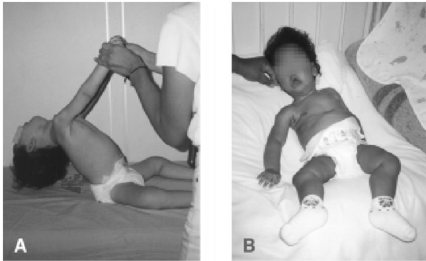
Figura 1 - Aspectos semiológicos das doenças neuromusculares em lactentes e crianças pequenas: a) DMC, criança de 12 meses de idade com hipotonia e fraqueza muscular: falta de resistência à movimentação passiva e grave retardo do desenvolvimento motor, com ausência de sustento cefálico; b) AEI tipo I (doença de Werdnig Hoffmann): fenótipo gravíssimo, criança não chega a sentar, comprometimento facial (boca em carpa) e deformidade torácica