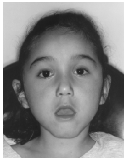
Figura 4 - Aspectos semiológicos das doenças neuromusculares em crianças - DMC merosina-negativa: debilidade e dismorfismo facial

Já um modo de instalação agudo ou subagudo, de caráter ascendente ou, ao contrário, acometendo preferencialmente a musculatura cervical e bulbar, eventualmente associado a uma história de infecção prévia ou a alterações cutâneas de caráter eritematoso, são dados indicativos das principais doenças neuromusculares adquiridas, respectivamente polirradiculoneurite desmielinizante aguda (Gui-