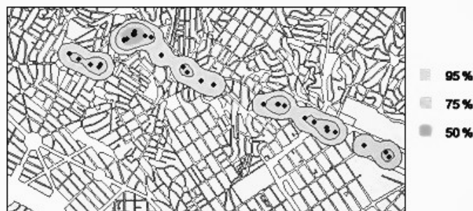
Figura 2 - Mapa de probabilidade de ocorrência do evento

Como resultado do cálculo estimador de densidade Kernel, identificamos as regiões nas quais há uma maior probabilidade do veículo estar (Figura 2). Na figura 4 as regiões delimitadas representam as probabilidades de 50 %, 75% e 95% dessas regiões conterem um veículo posicionado.