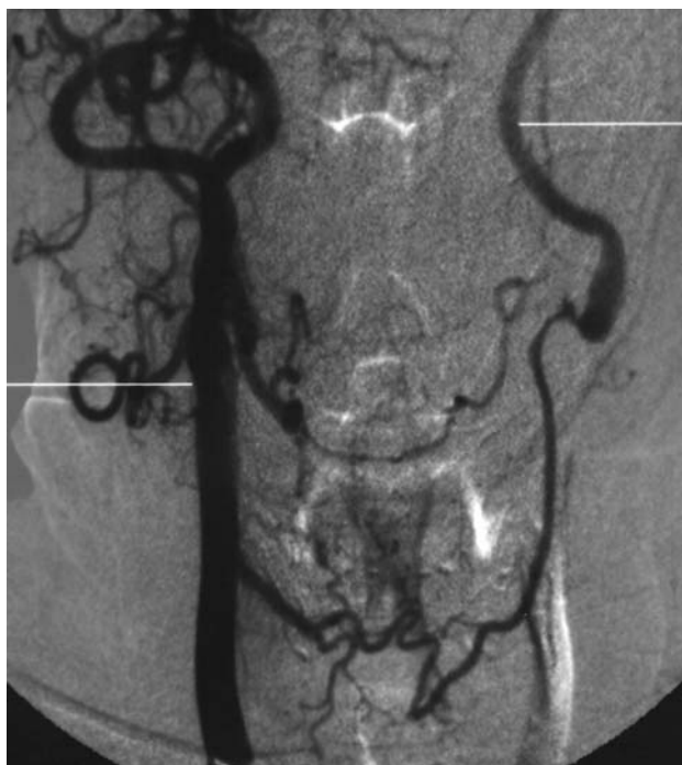
Figura 1 - Arteriografia: enchimento da artéria carótida esquerda através de circulação colateral da artéria carótida direita

des espessadas por placas calcificadas. Foi indicado o uso de antiagregante plaquetário, e foram mantidas as medicações anti-hipertensivas. Foi solicitada uma arteriografia que confirmou a oclusão da ACCE com circulação colateral cervical para a ACEE e enchimento da ACIE. As ACCD, ACID e ACED apresentavam-se com contorno irregular e com calibre preservados; foi identificada artéria vertebral direita dominante com estenose ostial crítica e artéria vertebral esquerda hipoplásica (Figura 1). Uma semana após a realização da arteriografia o paciente apresentou quadro de acidente isquêmico transitório novamente com deficit motor em membro superior direito, acompanhado de episódios de tontura. Foi mantido o uso de antiagregante plaquetário e de drogas anti-hipertensivas e solicitado novo ultrassom Doppler de carótidas, que evidenciou a patência da ACIE com fluxo proveniente da ACEE. O paciente foi submetido a endarterectomia da bifurcação carotídea (ACCE, ACIE e ACEE) com realização de enxerto subclávio-carotídeo à esquerda com prótese de politetrafluoretileno (PTFE) de 6 mm (Figuras 2 e 3). O procedimento cirúrgico foi realizado sob anestesia geral sem a necessidade de derivação temporária. O paciente evoluiu assintomático, recebendo alta hospitalar no terceiro dia pós-operatório. O ultrassom Doppler de carótidas e a arte-