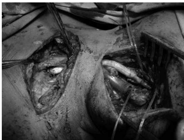
Figura 3 - Intraoperatório: enxerto subclávio carotídeo com prótese de politetrafluoretileno

riografia solicitadas 6 meses após a cirurgia evidenciaram a patência do enxerto subclávio-carotídeo à esquerda, mas com oclusão da ACEE e da artéria vertebral direita (Figura 4). O paciente permanece em acompanhamento ambulatorial há 2 anos, sem novos sintomas neurológicos.