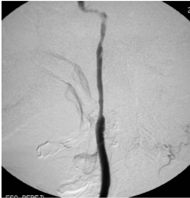
Figura 4 - Arteriografia: oclusão da artéria carótida externa e perviedade da carótida interna

cardíacas estão presentes em 59% dos pacientes 8 . Os mecanismos dos sintomas são multifatoriais e os mesmos da doença localizada na ACI e bifurcação carotídea 9 . Os pacientes acometidos por oclusão da ACC apresentam risco de ataques isquêmicos transitórios (AIT) hemisféricos, acidente vascular cerebral (AVC) ou sintomas vertebrobasilares 10 .