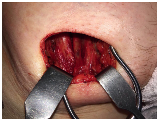
Figura 2. Identificação da crossa da safena e da veia femoral comum.