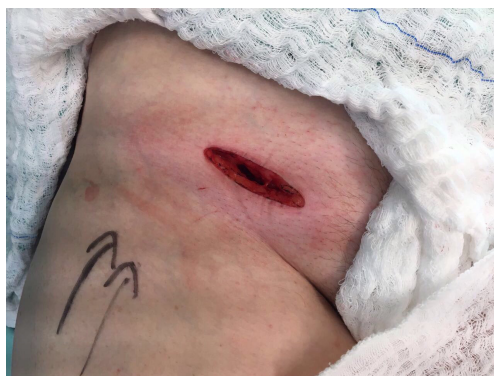
Figura 1. Incisão oblíqua acima do ligamento longitudinal.

em direção caudal até a completa exposição da junção safenofemoral, bem como das tributárias da veia femoral comum, evitando, assim, danos aos vasos linfáticos. Uma vez que a junção safenofemoral e a veia femoral comum foram identificadas, a crossa da safena interna foi ligada de forma rente à veia femoral comum, com fio inabsorvível, sendo dividida a seguir (Figuras 3 e 4). Para a síntese, foi realizada a aproximação dos flaps da fâscia pectínea e do tecido subcutâneo com fio absorvível e com fio monofilamentar não absorvível para a pele.