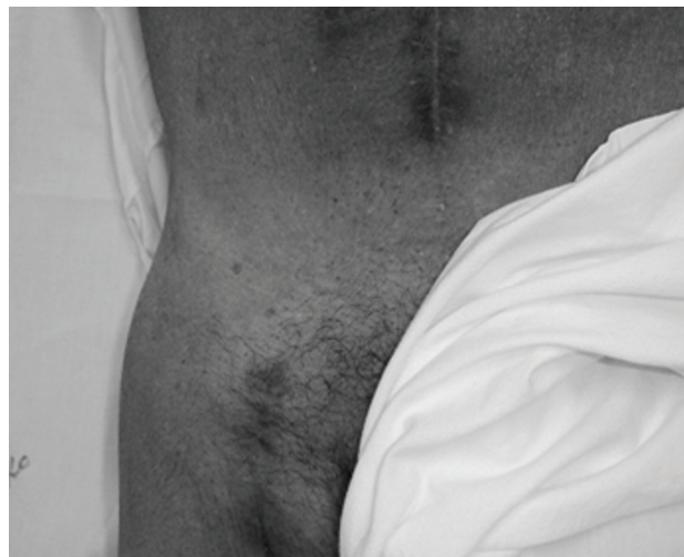
Figura 1 - Ausência de abaulamento em região inguinal direita no 90º pós-operatório

ultra-sonografia Doppler de controle não evidenciou coleção no local (Figura 2).