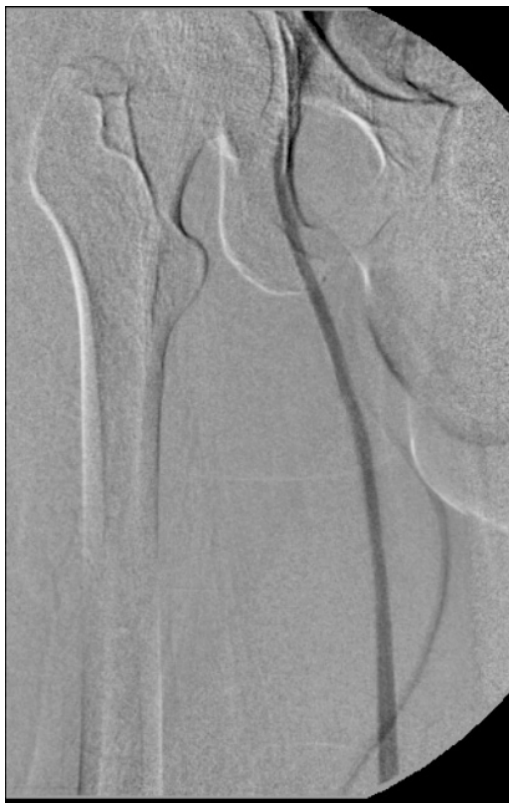
Figura 6. Flebografia ascendente mostrando veia safena magna e veia femoral comum. Não foi observada a veia femoral neste segmento.

Quase todas as malformações vasculares se beneficiam com tratamento compressivo, adequado, monitorizado e iniciado desde cedo, que evita uma piora progressiva