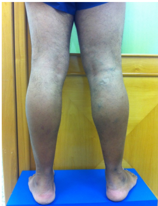
Figura 3. Membros inferiores com paciente em posição ortostática, vista dorsal, evidenciando varizes em perna proximal.

anatômicas. O exame físico fornece ferramentas para a construção do diagnóstico de IVC, mas não é suficiente para detectar as estruturas envolvidas e a extensão da lesão. Com isso, o exame inicial da investigação, o ultrassom vascular com Doppler, que foi solicitado neste caso, oferece análise anatômica e hemodinâmica das estruturas vasculares envolvidas, auxiliando no diagnóstico e na diferenciação dos