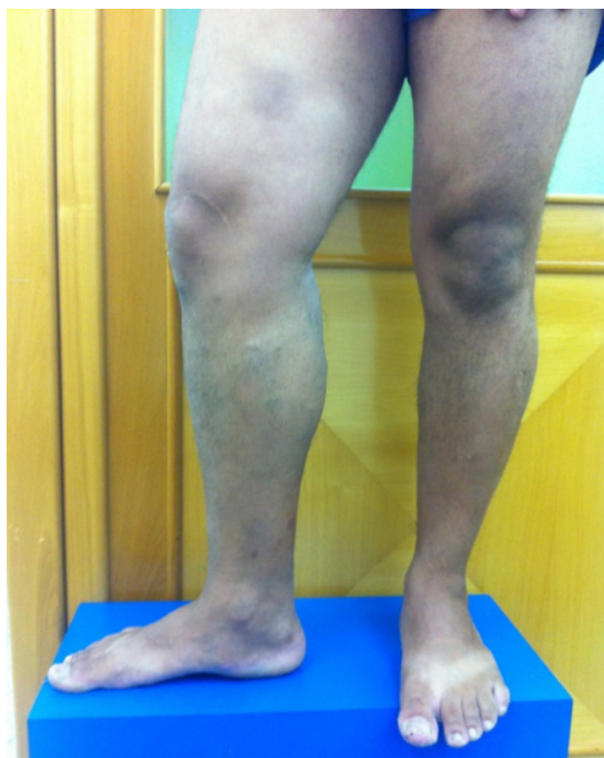
Figura 2. Membros inferiores com paciente em posição ortostática, vista frontal, evidenciando assimetria do membro inferior direito.

anatômicas. O exame físico fornece ferramentas para a construção do diagnóstico de IVC, mas não é suficiente para detectar as estruturas envolvidas e a extensão da lesão. Com isso, o exame inicial da investigação, o ultrassom vascular com Doppler, que foi solicitado neste caso, oferece análise anatômica e hemodinâmica das estruturas vasculares envolvidas, auxiliando no diagnóstico e na diferenciação dos