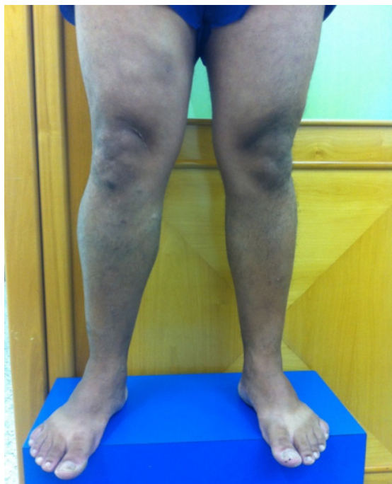
Figura 1. Membros inferiores com paciente em posição ortostática, vista frontal, evidenciando assimetria do membro inferior direito.

difícil e o paciente permanece por longos períodos com tratamento errôneo de outra doença vascular, que pode apresentar sintomas semelhantes aos de anomalias