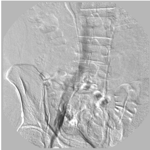
Figura 5. Flebografia ascendente mostrando veias ilíacas e cava inferior sem alterações.

Em estudo retrospectivo realizado com 445 pacientes (890 membros), que analisou a anatomia venosa com