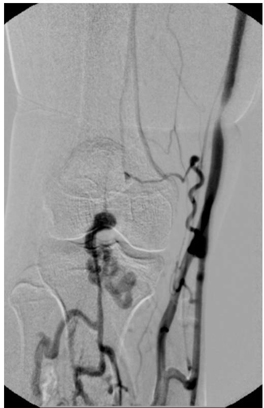
Figura 7. Flebografia ascendente mostrando veias profundas de perna com drenagem anômala para veia safena magna. Não foi visualizada a veia poplítea.