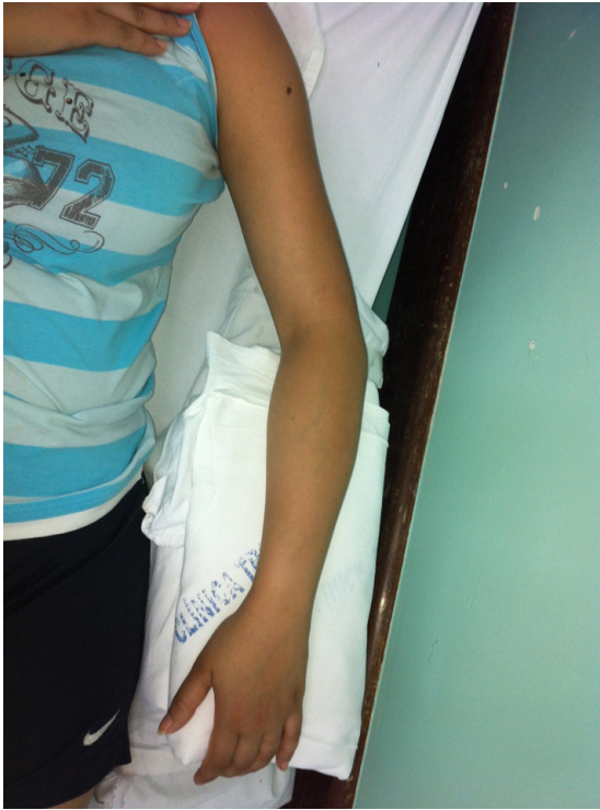
Figura 1. Primeiro dia de internação. Edema de todo o membro superior esquerdo.