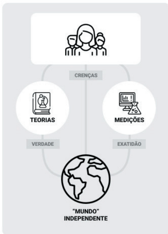
Figura 1. Ilustração do esquema intuitivo

ponto de partida). Por esse motivo, “crença”, “verdade” e “exatidão” são os seus conceitos centrais, como ilustrado na Figura 1. A partir de tal esquema, as seções seguintes esclarecem grupos de posturas realistas na filosofia das medições e as fragmentações deles.