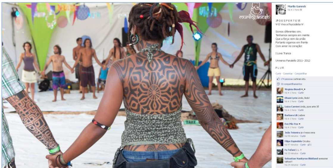
Figura 2 – Postagem selecionada na página do festival Universo Paralelo no Facebook