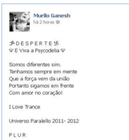
Figura 3 – Dizeres que acompanham a fotografia exposta na figura 2

Somos diferentes sim. Tenhamos sempre em mente Que a força vem da união Portanto sigamos em frente Com amor no coração!