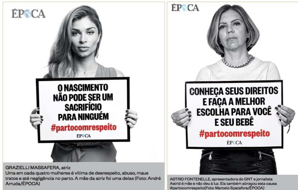
Figuras 3 e 4: Recortes da reportagem de ÉPOCA, “Vítimas da violência obstétrica: o lado invisível do parto”.