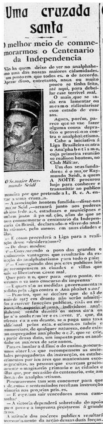
Figura 2 – Entrevista com o Major Raymundo Seidl