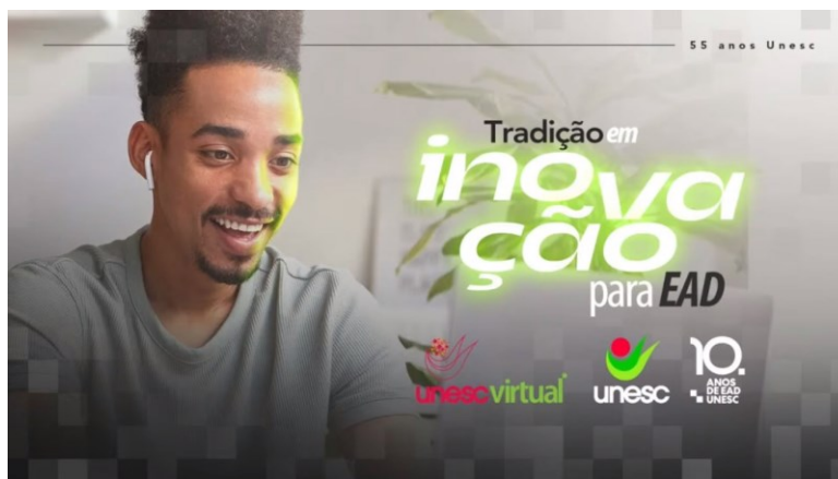
Figura 2 – Frame de vídeo de uma campanha publicitária institucional educacional

O primeiro vídeo faz parte de campanha publicitária de uma instituição de ensino superior. A Figura 2 consiste na imagem de um frame do vídeo que traz a materialização multissemiótica do argumentum ad antiquovitatem .