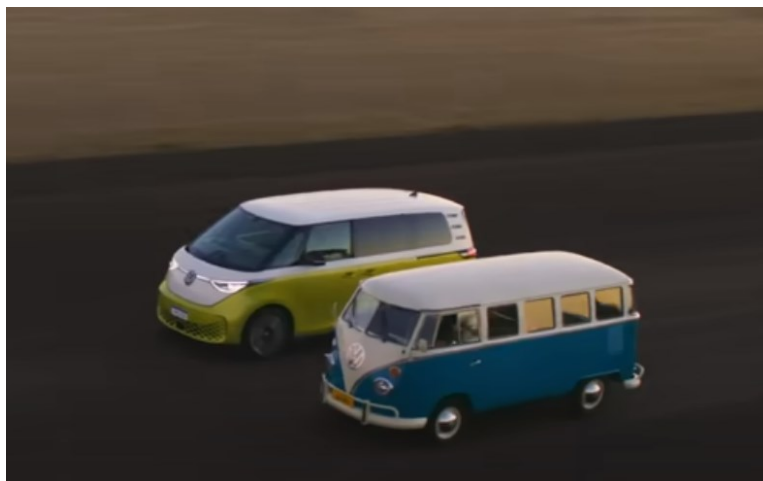
Figura 3 – Frame de vídeo de campanha publicitária da Volkswagen