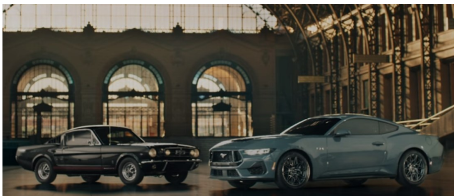
Figura 4 – Frame de vídeo de campanha publicitária da Ford

Podemos entender este frame como um texto imagético. Em vista disso, ele é considerado a materialização do discurso publicitário que organiza sua textualidade por meio da estratégia retórica de argumentum ad antiquitatem . Temos do lado direito um carro antigo, sucesso de vendas durante muitos anos no Brasil: a Kombi. Do lado esquerdo, um dos mais novos lançamentos da Volkswagen, o ID.Buzz, um carro elétrico que tem a qualidade de ser um carro grande, que leva muitas pessoas, mas está conectado com as novas tecnologias automobilísticas, alinhado ao atual discurso da sustentabilidade. A própria fabricante escreve em seu website que este carro é “A Kombi elétrica que vem carregada com muita tecnologia” 11 .