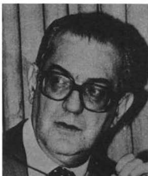
Banco de Dados — FSP