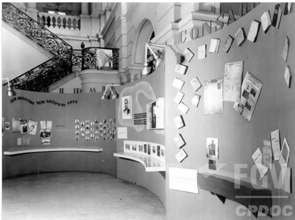
Figura 1: Vista parcial da exposição, no hall da Biblioteca Nacional.