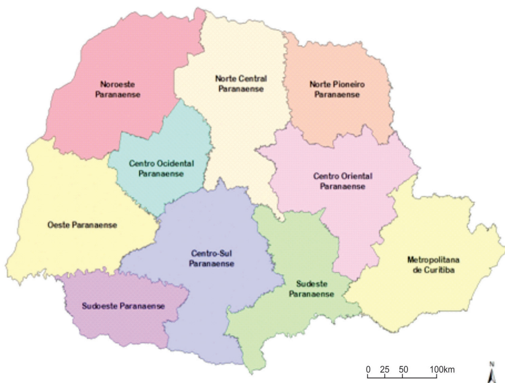
Figura 2 – Mesorregiões Paranaenses