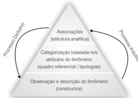
Figura 1 – Processo de construção de teoria

Neste contexto, deve-se destacar o esforço de Carlile e Christensen (2005) em sistematizar o processo de construção de teorias, estruturando-o dentro de um esquema de ciclos interativos. Para os autores, o processo (cumulativo) de construção e validação do conhecimento teórico ocorre em três estágios – observação, categorização e associação – e em ciclos dedutivos e indutivos que se complementam (Figura 1).