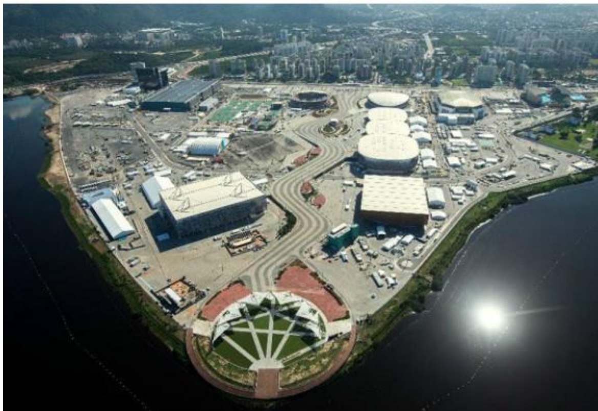
Figura 2 - O Parque Olímpico e sua “arquitetura nômade” – A mudança do planejamento de um século [Agenda 21] para a efemeridade da sustentabilidade num espaço-tempo comprimido

em grande parte oriundas de placas fotovoltaicas para a captação de energia solar; foi inserida como estratégia a proteção de bueiros, a utilização de trincheiras drenantes e tapumes, para evitar que impurezas infiltrem no solo e no ar, proteção e identificação das árvores e cursos de educação ambiental dados para os colaboradores que participaram das obras; toda a madeira empregada na modernização é certificada com o selo FSC (Forest Stewardship Council) e o cimento e o aço utilizados têm conteúdo reciclado (GOMES, 2015).