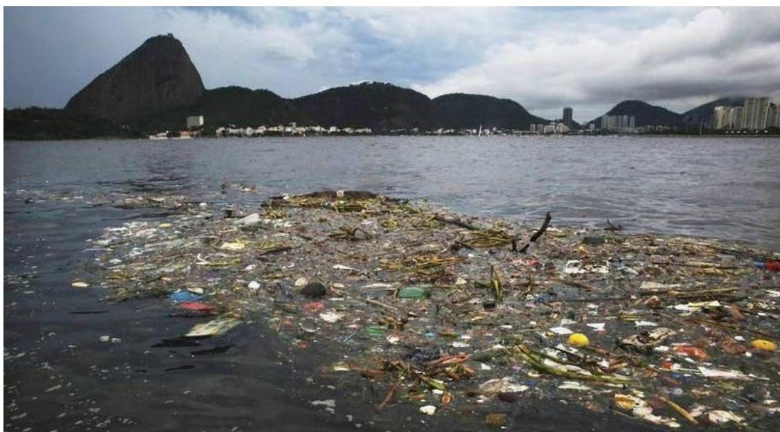
Figura 3 - “Os Jogos do Rio2016 condenados a conviver com a poluição”, segundo a RTP (Rádio e Televisão de Portugal). Há de fato um legado olímpico ambiental?