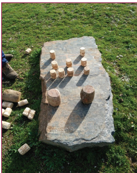
Figura 5 - Disposición de los bolos de Vinhais y Bragança en la caja, con distintos tamaños de bolos.

En referencia al juego de bolos, se constata la práctica únicamente en Paredes de Coura, municipio por el que pasa el Camino del Norte Portugués del Camino de Santiago, tratándose de una modalidad de bolos de derribo que no se asemeja a ninguna de las practicadas en Galicia. Sin embargo, en otras zonas del norte de Portugal, se han localizado dos municipios que registran actividad bolística, como son los municipios de Bragança (en las parroquias o freguesías de Terroso, Alimonde, Conlelas, Carrazedo y Castrelos) y Vinhais (en freguesías como Tohiselo, Fresulfe, Vila Boa, Santa Cruz, Pazo de Vinhais y Vinhais).