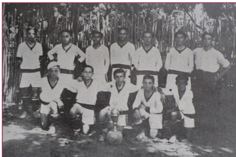
Figura 6 - O futuroso ROYAL S. C: Vencedor do Campeonato da Liga Esportiva dos alunos internos.