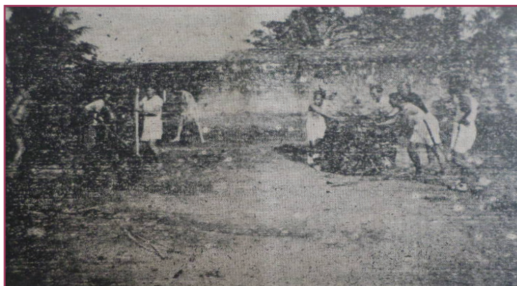
Figura 2 - A primeira mão para o novo estádio.