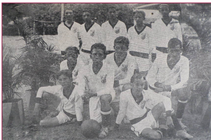
Figura 5 - O valeroso segundo quadro de foot ball.