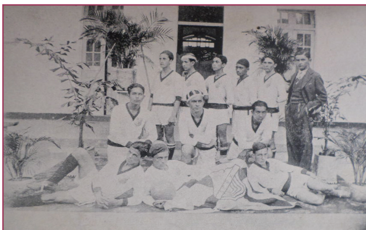
Figura 4 - O invencível primeiro team de foot ball.