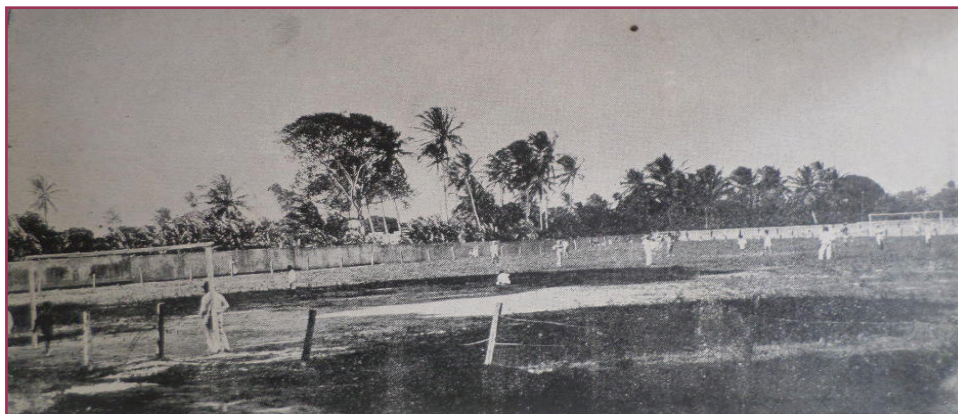
Figura 1 - Campo de foot ball do Collegio.