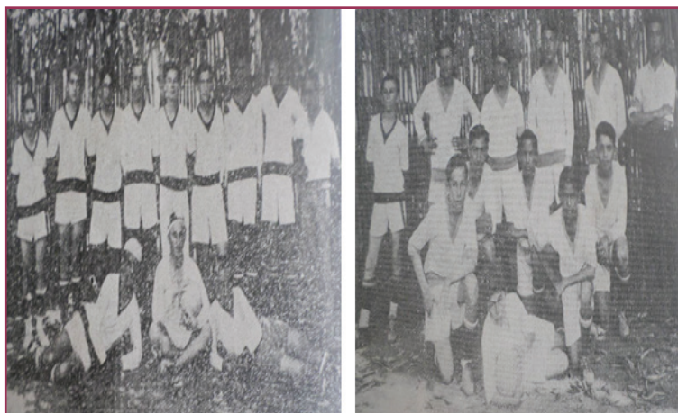
Figura 8 - O esforçado team de foot ball do Flamengo S. C.