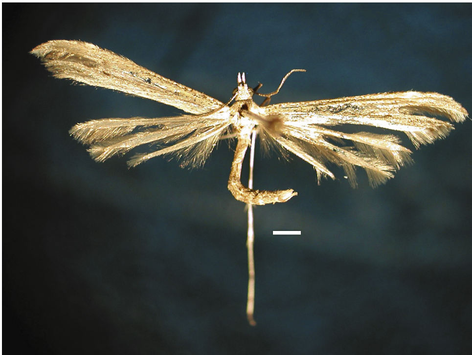
Figura 1. Lioptilodes friasi . Adulto macho en vista dorsal. Escala: 1 mm.