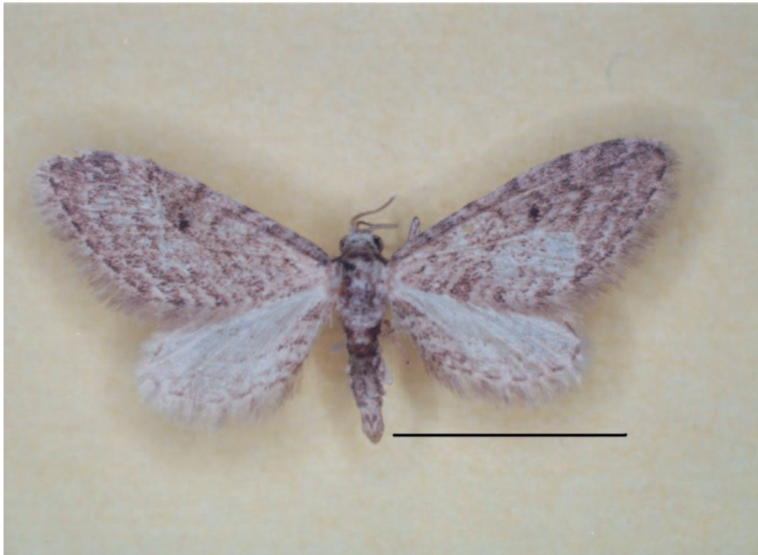
Figura 1. E. tamarugalis sp. nov. Adulto macho de en vista dorsal. Escala: 5 mm

Macho (Fig. 1). Cabeza cubierta mayormente por escamas de color pardo claro y algunas escamas castaño oscuro dispersas; ojos compuestos prominentes, circulares en vista lateral; palpos de longitud similar al diámetro de los ojos compuestos, de color similar al resto de la cabeza; antenas filiformes, con la superficie dorsal cubierta por escamas de coloración similar al resto de la cabeza, y la superficie ventral desprovista de escamas y débilmente ciliada. Torác cubierto de escamas de coloración similar a la cabeza; franjas castaño oscuras débilmente diferenciadas dispuestas sobre el margen anterior y posterior del mesotórax; tégulas cubiertas de escamas de color pardo claro. Ala anterior 7 mm de longitud máxima, dorsalmente cubierta de escamas de color similar al resto del cuerpo, con bandas antemedial, medial,