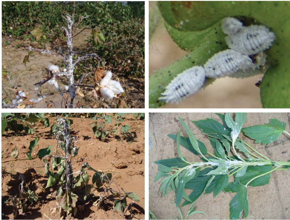
Fig. 2. Ataque de ninfas e adultos da cochonilha P. minor no ponteiro de algodoeiro G. barbadense (superior-esquerda) e na base de botão floral de algodoeiro G. hirsutum (superior-direita); ataque generalizado e morte de algodoeiro G. hirsutum (inferior-esquerda) e planta de gergelim atacada pela cochonilha (inferior-direita).