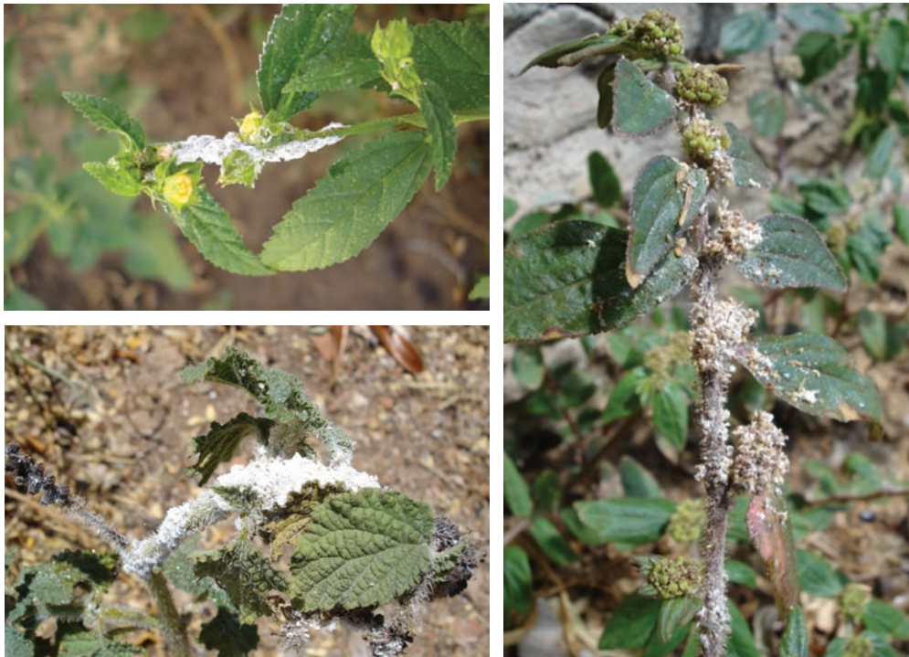
Fig. 3. Ataque da cochonilha P. minor em plantas espontâneas: guaxuma [ S. carpinifolia ] (superior-esquerda), fedegoso [ H. indicum ] (inferior-esquerda) e erva-de-santa-luzia [ E. hirta ] (direita).