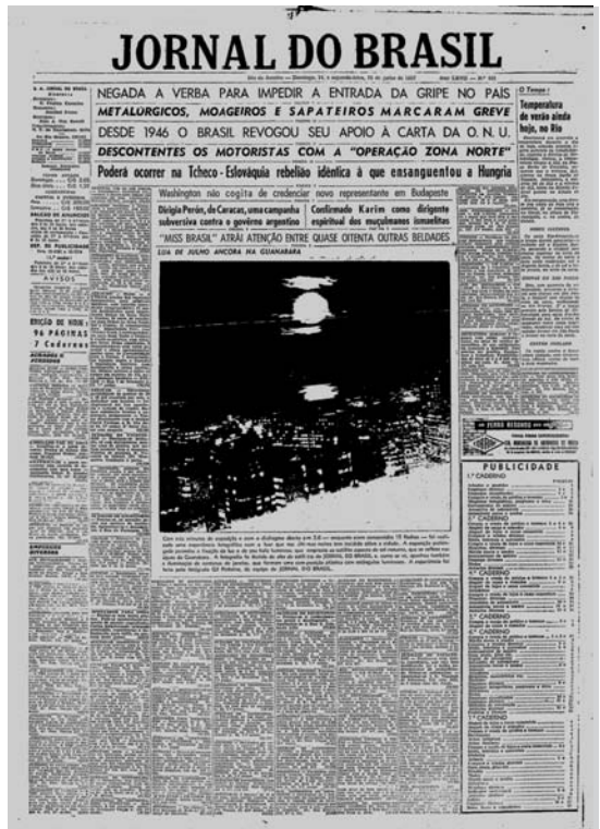
14 de julho de 1957