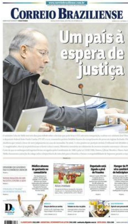
Figura 2 Cobertura do Correio Braziliense