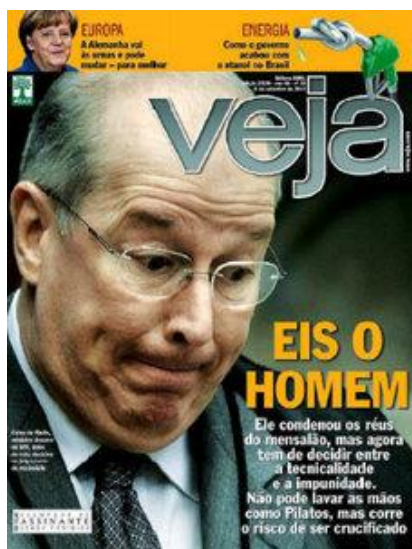
Figura 3 A personalização na cobertura de Veja

As revistas semanais imprimiram um tom ainda mais sensacionalista e igualmente personalizado, com o foco na figura do ministro Celso de Mello, além de muitas fotos de expressivo valor dramático (Figura 3). No texto da legenda destaca-se em primeiro lugar uma ação anterior do magistrado: “Ele condenou os réus do Mensalão”, seguida da expectativa acerca de sua decisão futura quanto aos embargos e de uma recomendação imperativa: “não pode lavar as mãos”. Ressalta-se ainda o antagonismo entre a tecnicidade e a impunidade: