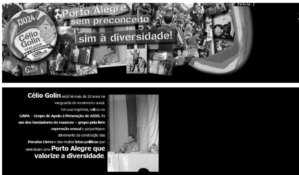
Figura 8 Célio Golin (PT/Porto Alegre)

Este tipo de website, menos comum, utiliza recursos mais sofisticados de interação e comunicação (não exibidos na Figura 8) para promover políticas que beneficiam um grupo específico ou fortalecem a presença e a identidade simbólica de tal grupo.