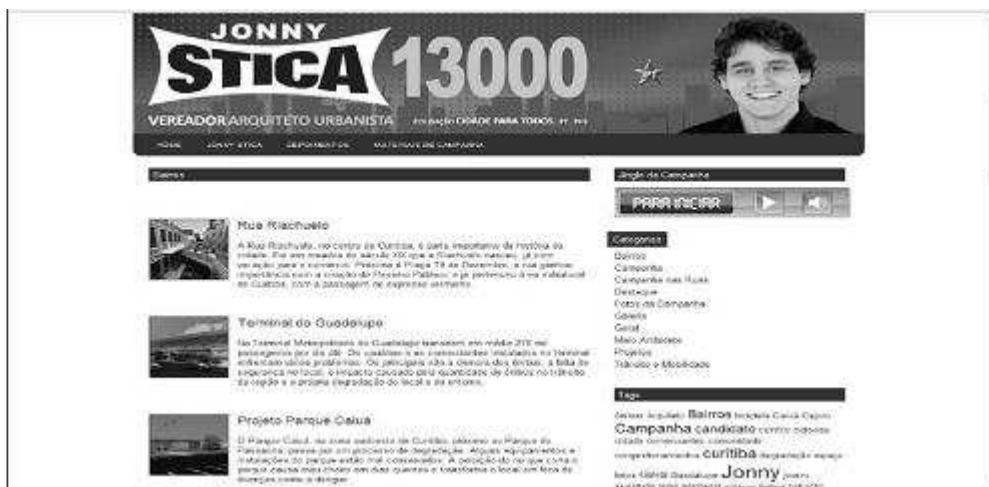
Figura 11 Jonny Stica (PT/Curitiba/eleito)

f) Comunicação e informação com ênfase na atividade parlamentar (1,8%)