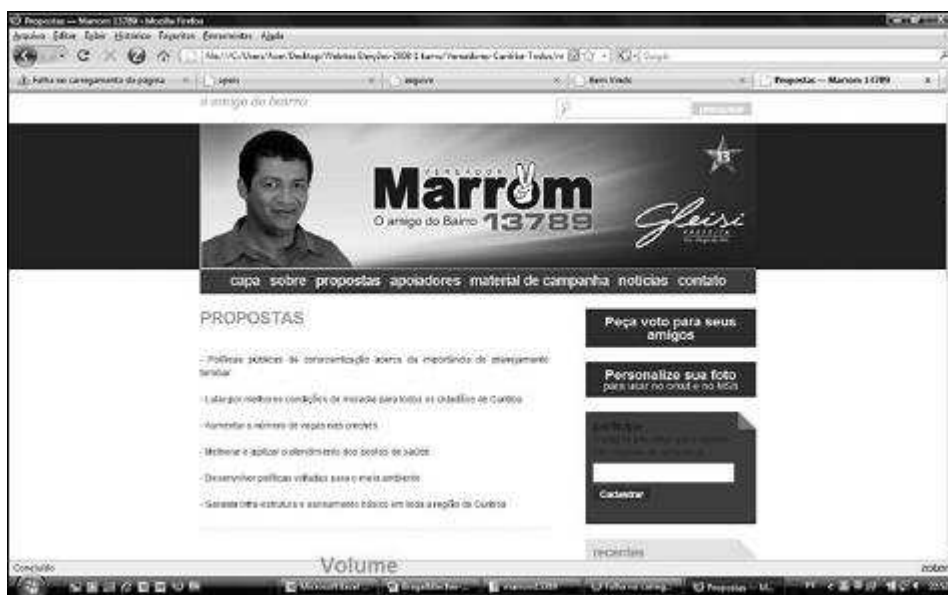
Figura 3 Marron (PT/Curitiba)

Este tipo de website é especialmente usado pelos candidatos aos quais os partidos fornecem “modelos (templates) de websites” mas não buscam fornecer maior densidade programática na divulgação de suas propostas. É o caso, por exemplo, dos websites da maior parte dos vereadores do PT e do PPS nas eleições de Curitiba, partidos que elaboraram “templates” para os candidatos divulgarem suas propostas, mas cujo conteúdo não enfatizava a identidade ou a linha partidária. Não possuem, portanto, uma definição programática ou simbólica mais definida (Figuras 3, 4 e 5):